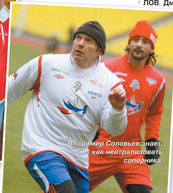
Владимир Соловьев знает, как нейтрализовать соперника.